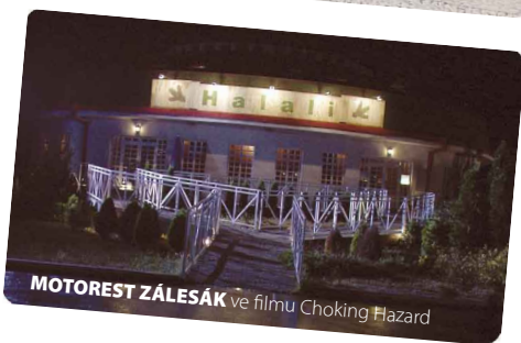
MOTOREST ZÁLESÁK ve filmu Choking Hazard