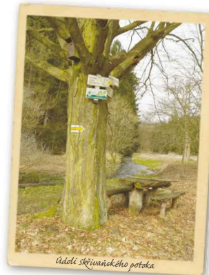
Údolí Skřivánského potoka