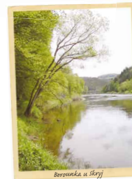
Berounka u Skryj

Hostinec U Rozvědčika byl první místem na Křivoklátsku, kam Ota Pavel s rodiči a bratry jezdili na letní byt. Pobyli tu však jen dvě léta. „Nebylo to ono,“ vysvětluje Pavel v povídce Smrt krásných srnců. „V sobotu a v neděli tam byl kravál. Přijely spousty trempiků, čundráků, vandráků a kovbojičků a z tiché hospůdky udělali peklo hodné Západu. Po jedné takové bouřlivé noci byl tatínek donucen najít selskou chalupu. A tak nás naložil na škuner a plul k domečku pod Bránovem, kde se říkalo v Luhu.“