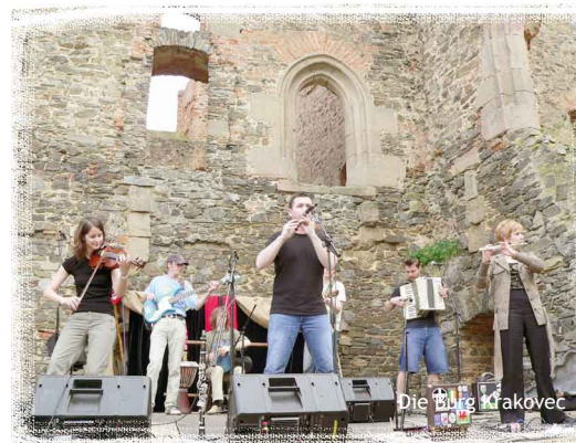
Die Burg Krakovec

Die Burg Krakovec ist ein Wallfahrtsort tschechischen Volkes, denn er war der letzte Ort im Böhmen, wo der katholische Reformator Jan Hus vor dessen Martertod in Constanz (6. 7. 1415) aufhielt. Tag de sFeuertodes von Hus ist in Tschechien Staatsfesttag. Gothicische Burg Krakovec, die in den Jahren 1381 - 1383 erbaut wurde, gehört zu Meisterbauten tschechischer Burgarchitektur. Zur Burg führt eine Holzbrücke, die in den Jahren 2001 - 2005 mittels mittelalterlichen Technologie und Werkzeuge gefertigt wurde.