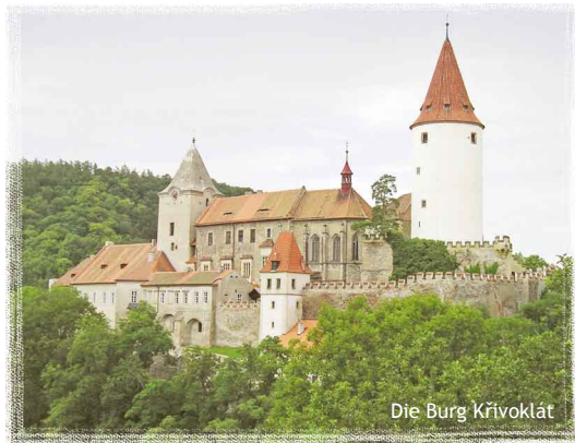
Die Burg Křivoklát