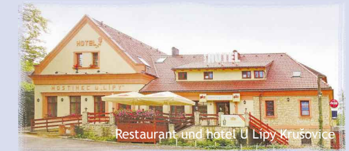
Restaurant und hotel U Lipy Krušovice

Hotel Jesenice - Hotel mit 76 Betten. Ein modernes Hotel am Ufer des Grossen Teiches im Sommersitz Jesenice.