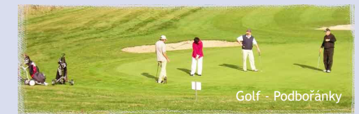
Golf - Podbořánky

Tennis, squash, bowling - Tennis Zentrum Cafex in Rakovník. Auch andere Sportarten und Unterkunft stehen Ihnen zur Verfügung.