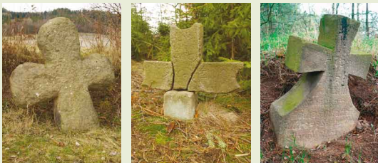
2. kříž u Václav. 3. kříž u Václav. Kříž u Podbořánek.