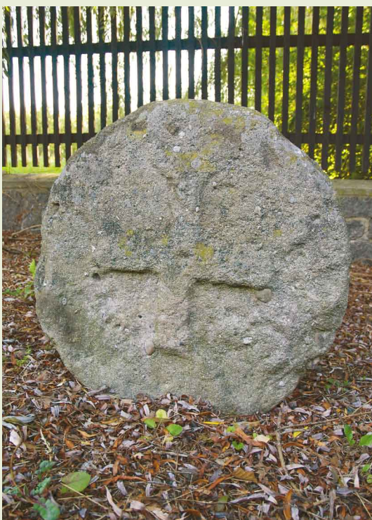
„Celní kolo“ u Velkého rybníka v Jesenici.