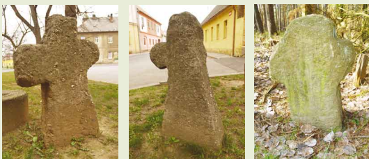
Kříž u muzea v Jesenici. 2. kříž u muzea v Jesenici. Kříž v lese severně od Kožlan.