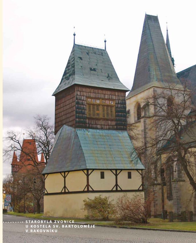
STAROBYLÁ ZVONICE U KOSTELA SV. BARTOLOMĚJE V RAKOVNÍKU