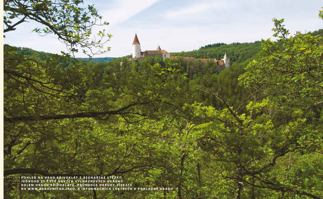
POHLED NA HRAD KRIVOKLÁT Z BEDNÁRSKÉ STEŽKY, JEDNOHO ZE ČTYŘ NOVÝCH VYCHÁZKOVÝCH OKRUHŮ KOLEM HRADU KRIVOKLÁTŮ. PRŮVODCE OKRUHY ZÍSKÁTE NA WWW.RAKOVNICKO.INFO, V INFORMAČNÍCH CENTRECH A POKLADNĚ HRADU