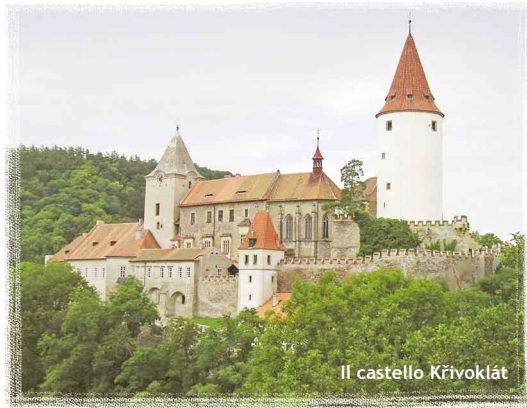
Il castello Křivoklát