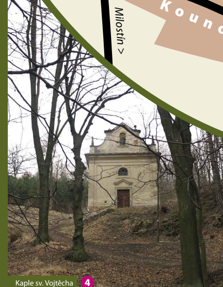
Kaple sv. Vojtěcha 4