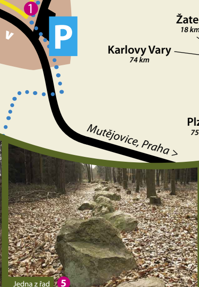
Jedna z řad 5